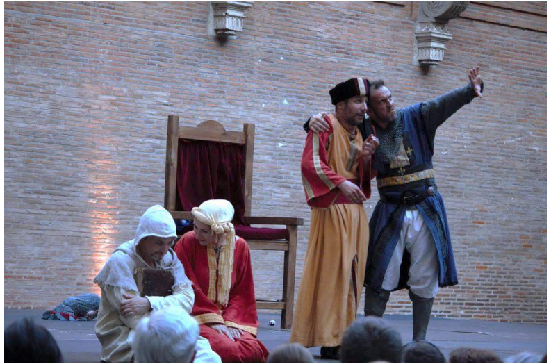
Une galerie habitée par l'histoire